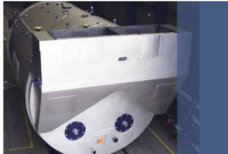
Economiseur rapporté pour un fonctionnement individuel illimité des brûleurs

Les éléments de guidage d’eau qui améliorent la circulation de l’eau de chaudière aident à éviter des chutes de température critiques. Tout particulièrement dans des phases de charge réduite ainsi que lors de la mise en ou hors service d’une chaudière.